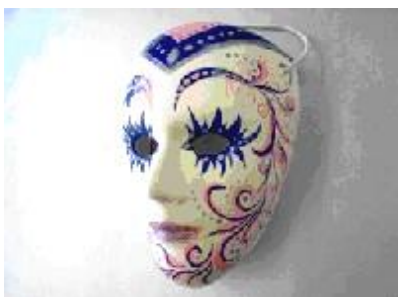
Felelős kiadó: Ács Péterné Szerkeszti: Kollégiumi médiaműhely

lassú táncot ropta Puli Pali csárdást, ahogy meg van írva; sötét szőre, bozontja a szemébe lógna. Csau csacsacsázna, a foxi bokázna, a többi vén kutya meg leülne a hóba.